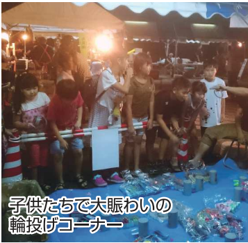
子供たちで大賑わいの輪投げコーナー

これからも青年部は、地域おこしと、地元の皆さんのお役に立つような活動を行っていきます。