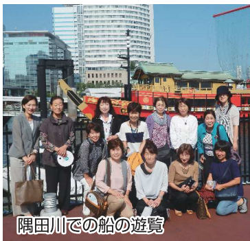
隅田川での船の遊覧

状況下、小規模事業者が生き残るためには、大型店やチェーン店にない商品、サービスが必要で、それが逸品です。植松先生は、「良いものが高く売ること。自社の強みを生かす、自信を持つことが重要」と指導しました。