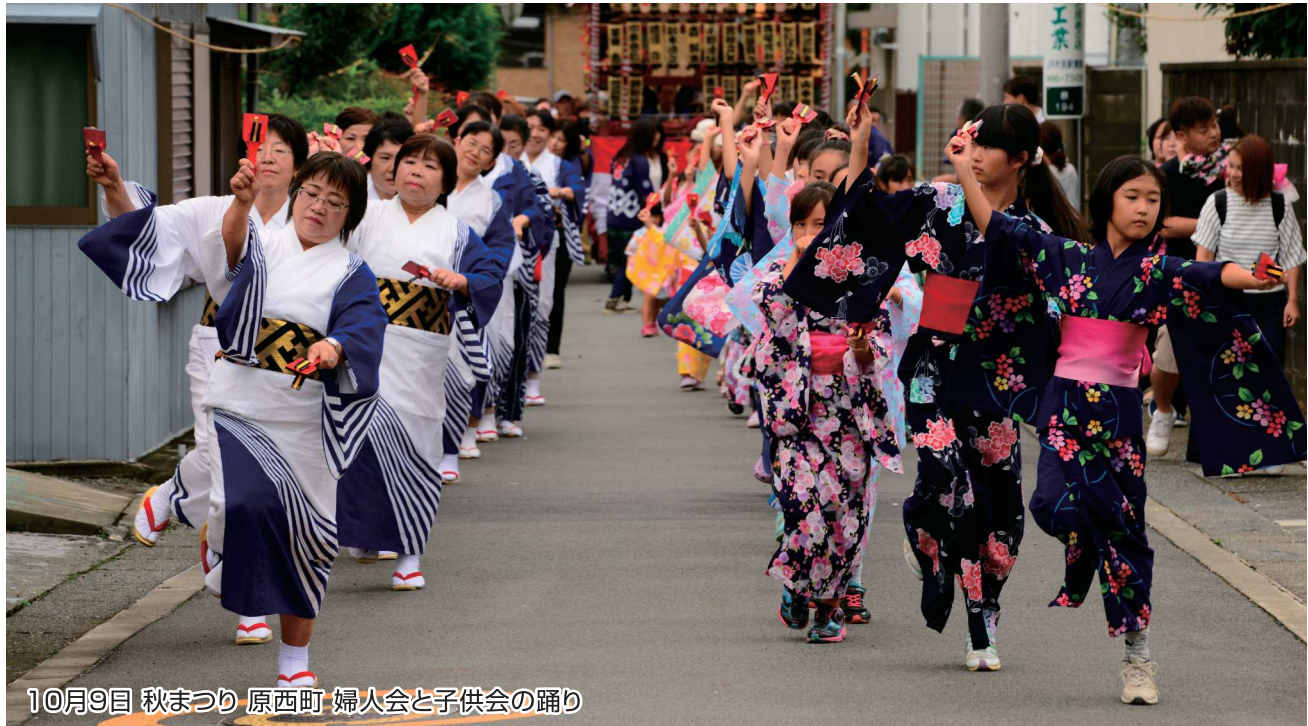
10月9日 秋まつり 原西町 婦人会と子供会の踊り

No. 89 発行者 沼津市商工会 会長 大村保二 〈本所・原支所〉沼津市原1200番地の1 TEL(055)966-1331 FAX (055)967-4925 〈戸田支所〉沼津市戸田1028番地の5 TEL(0558)94-2224 FAX (0558)94-4029 編集 沼津市商工会広報委員会