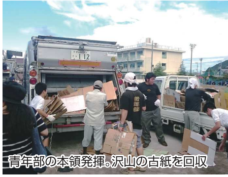
青年部の本領発揮。沢山の古紙を回収

青年部は持ち前の結束力と機動力で、戸田の隅々の家まで古紙を集めて廻りました。今年も暑い中の作業となりましたが、廃品回収作業に汗を流す中学生の姿に大いに刺激を受けました。