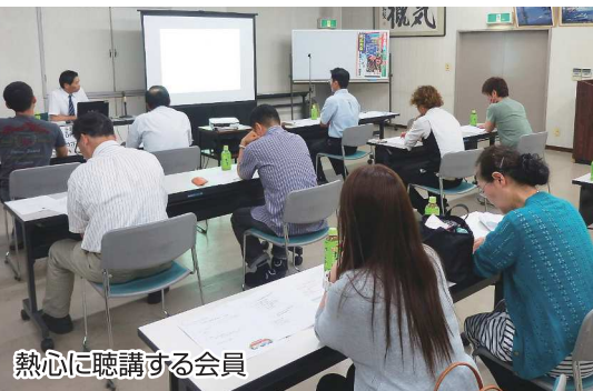
熱心に聴講する会員

沼津市商工会が本年度重点事業として取り組んでいる伴走型小規模事業者支援事業のテーマは一店逸品運動です。会員、とりわけ小規模事業者に対し、本会が今後取り組む一店逸品運動とは何か、目指すことは何か、逸品づくりの手法について、7月13日に講習会を開催しました。講師は植松中小企業診断士。